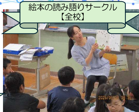
絵本の読み語りサークル 【全校】