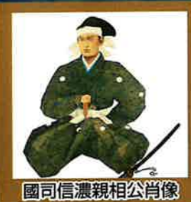
國司信濃親相公肖像

昭和62年度からの生涯学習を推進する町づくりの中で、本校区は平成4年度から3年間「豊かな感性を育てる教育モデル地区」として指定された。平成7年度から3年間は、文部省の「体力づくり」指定校となり、平成9年度に研究発表会を行った。平成12年度から2年間は、楠町の道徳教育推進指定校として感性教育・健康教育に力をいれ、以降心身ともに調和の取れた児童の育成に取り組んでいる。また、平成25年度からコミュニティ・スクールとなり、地域ぐるみで教育環境の充実も図られている。