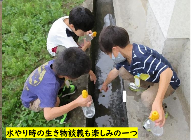
どこかにつぼみがないかなあ...