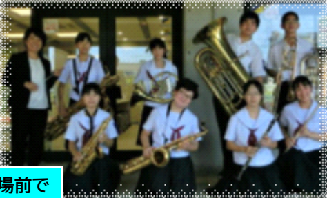
コンクール御会場前で

8月4日、吹奏楽コンクールが行われ、C部門で優良賞を受賞しました。3年生にとっては中学校最後のコンクールでしたが、運動会、文化祭での演奏に向けて、練習が続いています。精一杯頑張ってきた部活動の締めくくりとなるよう、取り組んでくれることを期待しています。