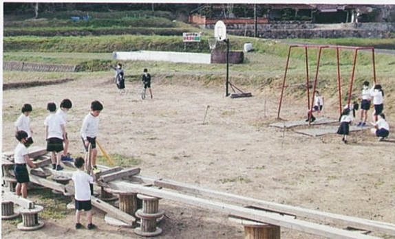
ひだまり広場で遊びます