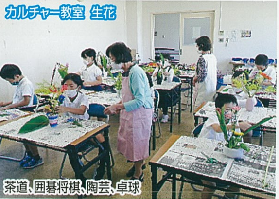
茶道、囲碁将棋、陶芸、卓球