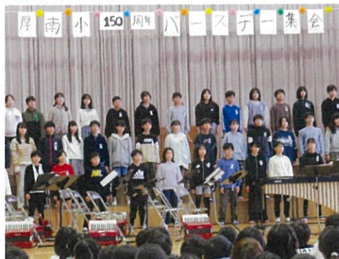
心温まる音楽発表をしてくれた6年生！

現在、航空写真や横断幕のデザインなど6年生の PT による企画が同時進行しており、卒業まで6年生が良い流れをつくり、在校生にバトンを渡してくれる予定です。最上級生のパワーに感謝するとともに、在校生にも「自分たちに何ができるのか」を意識しながら、150周年記念事業を盛り上げ、自身の成長のきっかけにしてほしいと願っています。