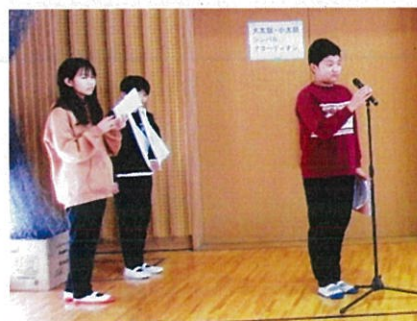
会を進行するPTの子どもたちに感謝！