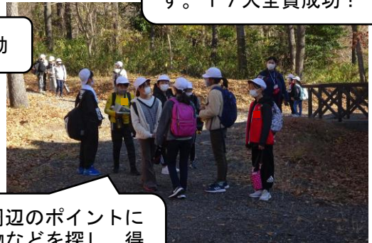
自然の家周辺のポイントにある自然物などを探し、得点を競いました。