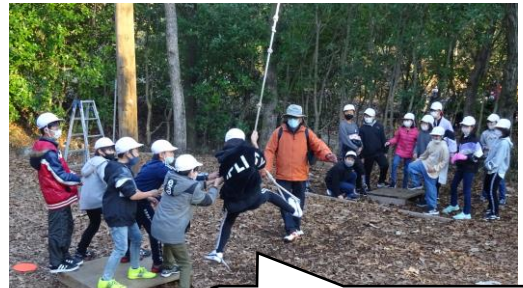
ターザンロープで小さな板の上に渡る挑戦です。17人全員成功！