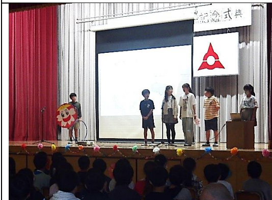
6年発表「厚南小150年の歴史」