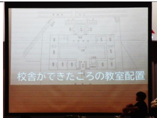
厚南小の様子を伝えています