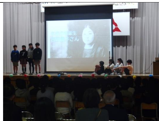
吉岡藤子先生についての発表