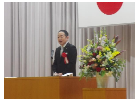
来賓祝辞 宇部市長 篠崎圭二 様