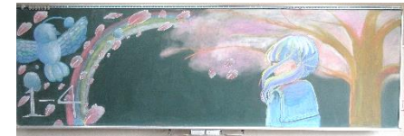
【美術部による黒板アート】