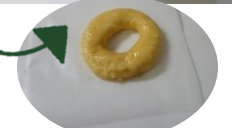
クッキングシートの上でドーナツ状に