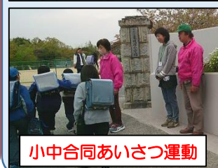
小中合同あいさつ運動