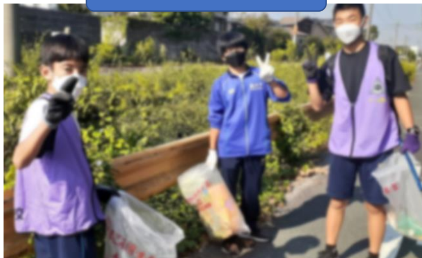
線路沿いのごみを集める隊員