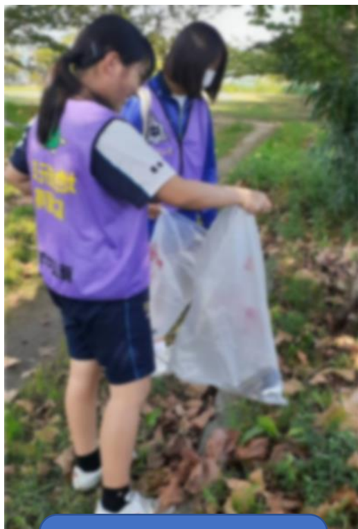
鵜ノ島59区ヤング自治会員と協力して落ち葉で隠れたごみを拾う隊員