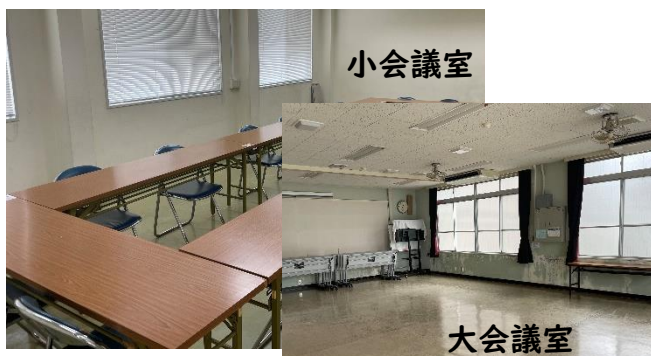
藤山地域 MIRAI(ミライ)塾(鶺の島教室) 鶺の島ふれあいセンター