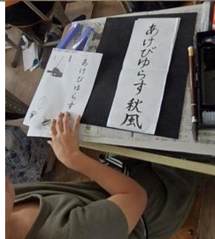
今週の学習の様子