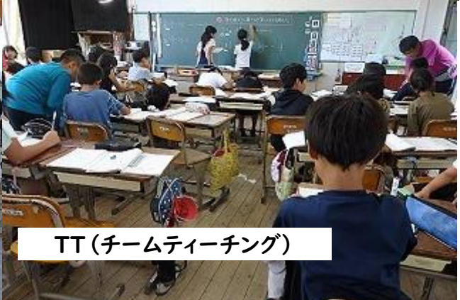
TT (チームティーチング)