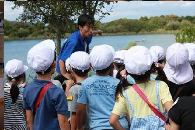
10月3日(木) 1年生バス遠足 山口宇部空港 きらら浜自然観察公園