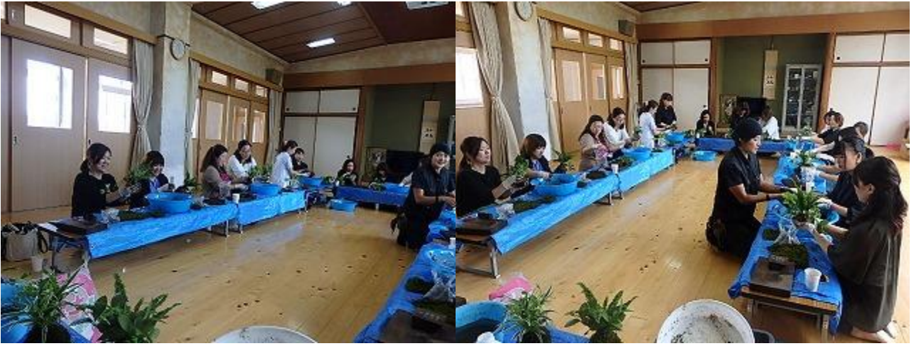
10月3日(木) 家庭教育学級 礼法室