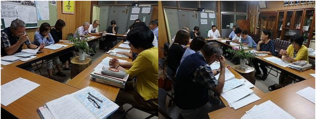
10月1日(火) 第3回学校運営協議会 校長室