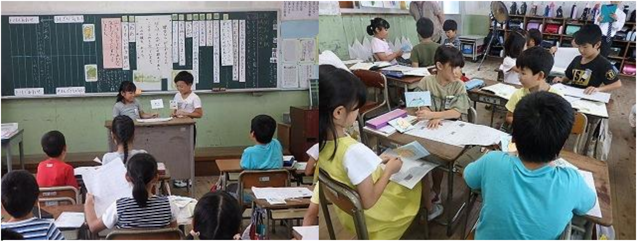
2年3組 研究授業 国語科 「お手紙」