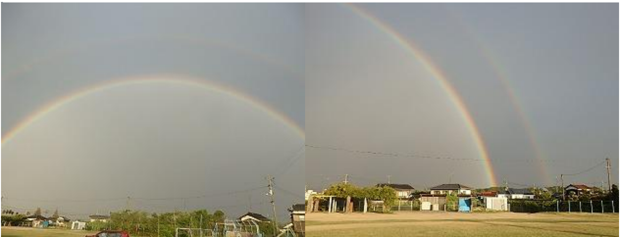
10月3日(木) 二重の虹 運動場から