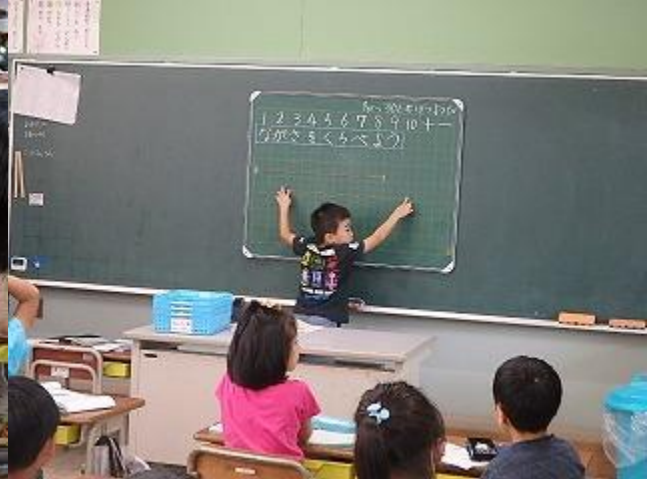
1年生 算数科の授業 「ながさくらべ」 ペア学習と発表の様子