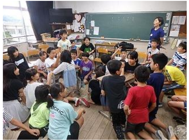
今週の学習の様子