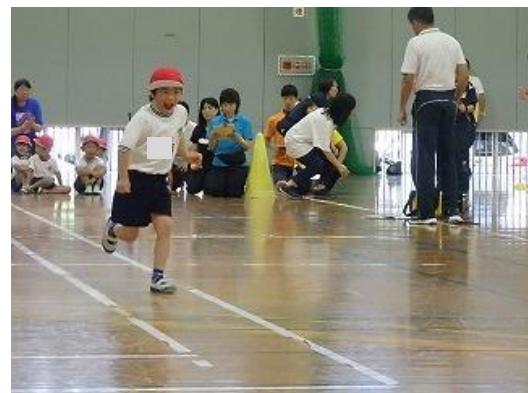
10月4日(金) なかよしふれあい運動会 西部体育館