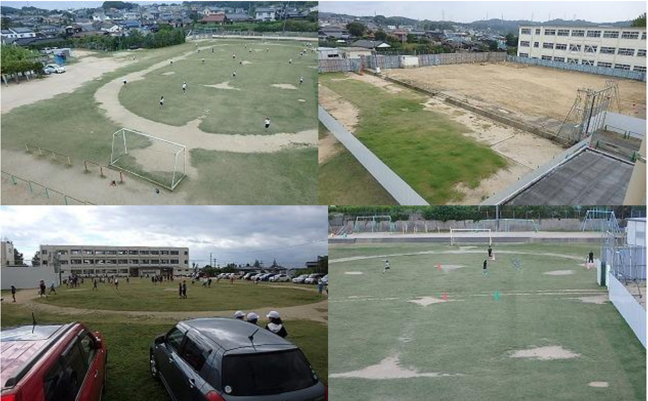
今週の運動場と体育館工事