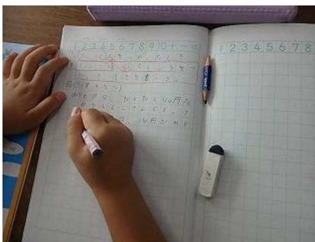
9月30日(月) 2年1組 教育実習開始 算数科の授業とノート(答えの理由)