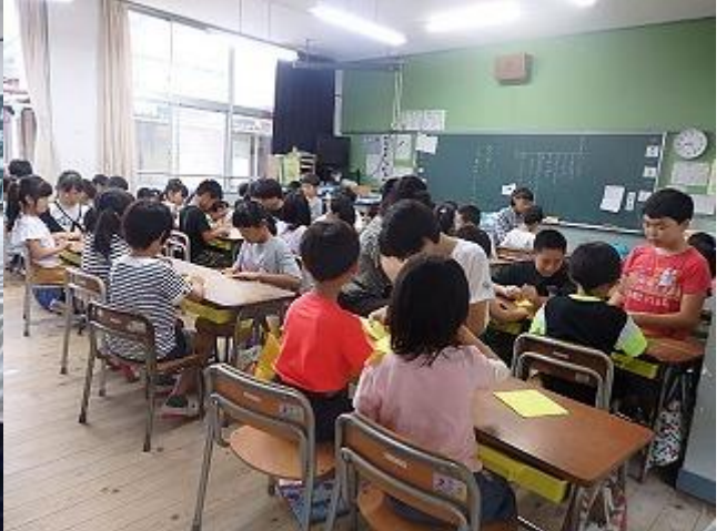
2年3組 研究授業 国語科 「お手紙」