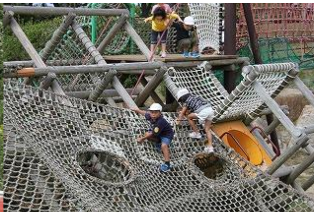
10月3日(木) 1年生バス遠足 山口宇部空港 きらら浜自然観察公園