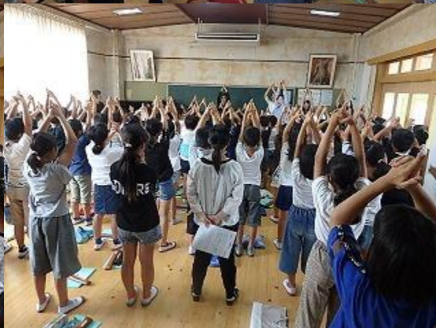
9月30日(月) 芸術家の派遣事業(3回目) 4年生リコーダー・歌唱指導 礼法室