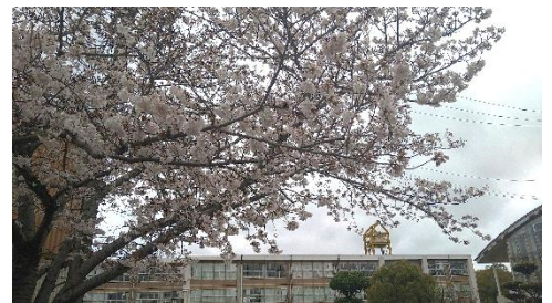
【4/4 桜の花が満開です】