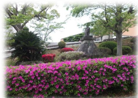
今からが見頃！ツツジの花

船木小の春は百花繚乱。ツツジの花は、色も種類も様々で、満開になると本当に見事です。また、溝の中や草原では、生き物も活発に動き出しています。3～5年生の理科では、4月の学習内容に、春見つけ、菜の花のつくり、チョウの幼虫を飼うなど、自然に関連した内容が多くあります。教室の前には、飼育ケースがいくつか置かれ、ワイワイと中を覗いている子どもたち。生き生きとした表情です。友達と外で虫を捕