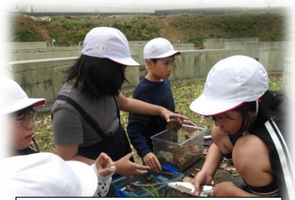
ダンゴムシのすみかを作ろう！

まえて飼育方法を考えたり、草花を摘んで遊んだり花のつくりを観察したりする体験は本当に貴重です。四季の変化や生き物との関わりは、感性を豊かにし、心の落ち着きを育てると言われています。また、自然現象の観察や考察は、思考力や創造性を伸ばすことにつながります。豊かな船木の自然から、生命の尊さ、美しさ、素晴らしさを肌で感じ、心豊かな船木っ子に育ててほしいと願っています。